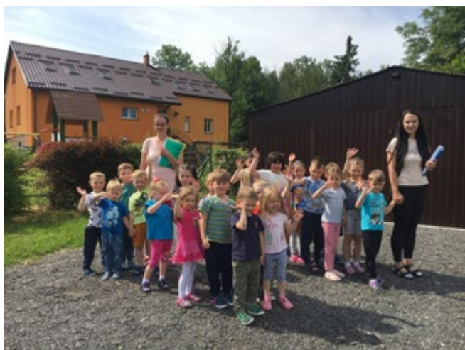
Cvičný evakuační poplach jsme zvládli na výbornou