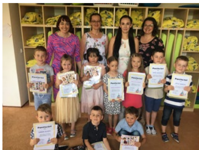
Loučení s předškoláčky