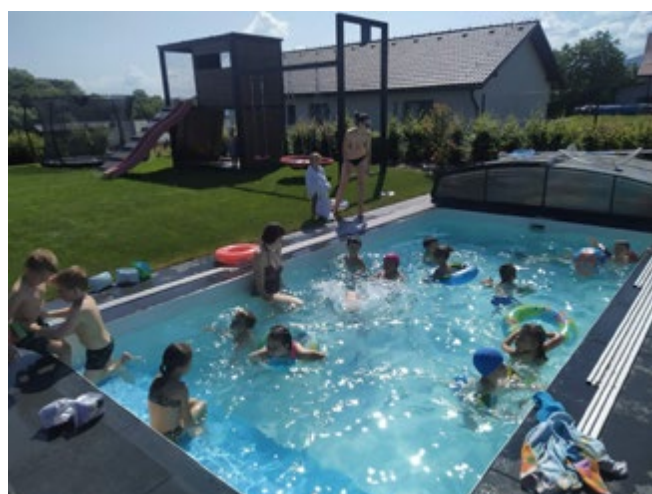
U kamaráda v bazénu