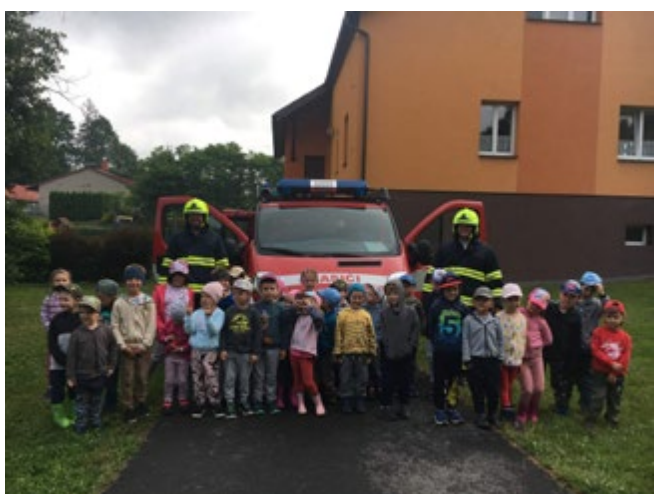
Prohlídka hasičského vozu