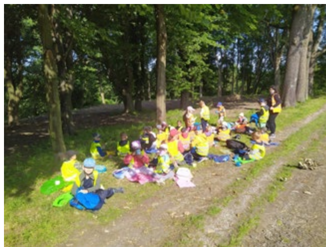
Výlet do hrníčkového háje