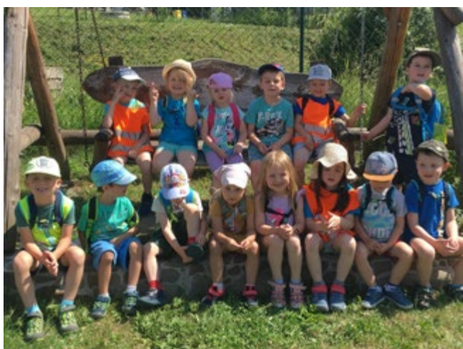
Na zahradě u paní učitelky