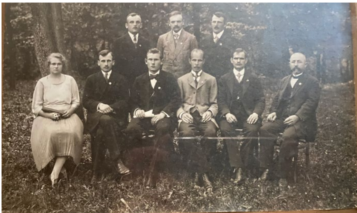
Výbor odboru M. O. L. ve Vojkovicích.