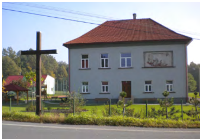
Po celkové rekonstrukci v r. 2010

S posledními stavebními úpravami se započalo v roce 2020. Sociální zařízení jak pro přízemí, tak pro patro se zřídila v nové přístavbě. Splachuje se ekologicky, tzv. dešťovkou. U budovy byla zapuštěna nádrž na zachytávání dešťových vod. Střecha přístavby je tzv. zelená; je zcela pokryta půdou a vegetací. Následovala kompletní rekonstrukce vnitřních prostor budovy. Stropy byly zcela vyměněny, na schodiště a podesty byla položena nová dlažba. Na podestách zůstal zachován zdobný styl podobný tomu, který je pokrýval v minulosti. Zdobené zárubně dveří byly zachovány a natřeny. Klubovna č. I v prvním patře budovy byla kompletně vybave-