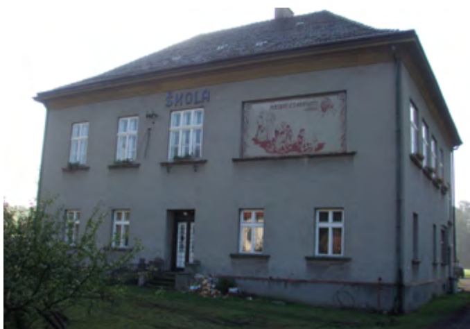
Škola před rekonstrukcí

na novým nábytkem, projektorem s plátnem a ozvučovací technikou, do klubovny č. II byla pořízena ozvučovací technika s televizorem o úhlopříčce 190 cm. Kuchyně v prvním patře se přesunula do prostor bývalého sociálního zařízení, byla rovněž zcela nově vybavena a se sousedící klubovnou propojena výdejním okénkem. Sál v přízemí se rovněž rozšířil o prostor bývalých WC, kam je dnes možno umístit např. raut. Rovněž přízemí se pyšní novými podlahami, novou kuchyní a v místnosti sousedící s kuchyní byl zřízen výčepní pult. Klubovny prvního patra jsou k dispozici místním spolkům, přízemí se pronajímá veřejnosti. Aktuálně se ve škole dokon-