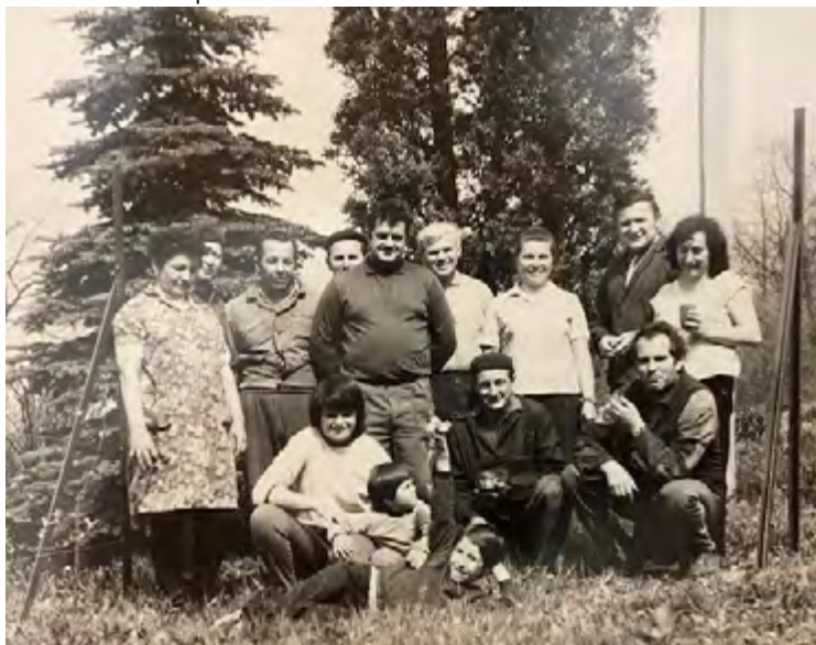
Brigáda rodičů, květen 1975

V témže roce se naše knihovna pod vedení paní učitelky Sojkové umístila na krásném sedmém místě z celkového počtu 76 knihoven v okrese.